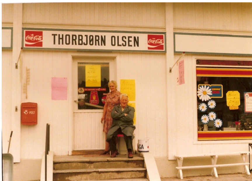
Her er mor og far på butikktrappa

Vareutalget var begrenset, og mye av varene kom i store kolli (sekker, spann, tønner og kasser). Innholdet ble tømt over i skuffer under disken og måtte senere veges opp ved utsalg til kundene. Det kunne være mel, gryn, farin, kokesukker, sirup, raffinade m.m. Husker også melka kom i store melkekjeler med egen bil fra meieriet og ble øst opp i små melkespann som kunden hadde med seg. Målet var en "skaupe" som tok 1 liter.